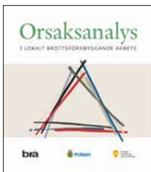
Orsaksanalys i lokalt brottsförebyggande arbete. Handbok. Stockholm: Brottsförebyggande rådet (2018).