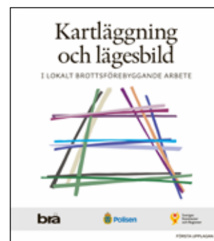
Kartläggning och lägesbild (1:a uppl.) Handbok. Stockholm: Brottsförebyggande rådet (2021).